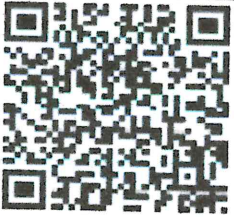
Imagen Original del Timbre:

SubTotal: 331.90 Iva: 53.10 Total: 385.00